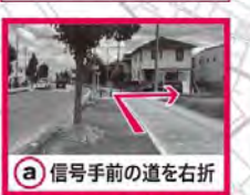
a 信号手前の道を右折

スタート受付にて、ちよびりプレゼントが ございます。 ※十分な数量終了いたします。 ニューシャトルグッズの販売ブースがございます。 ※10月27日(金)は内宿駅売店を利用ください。